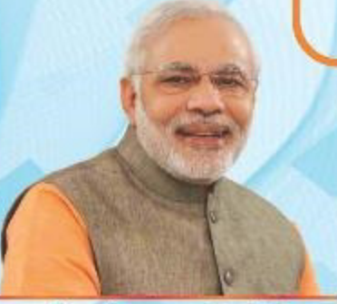
શ્રી નરેન્દ્રભાઈ મોદી